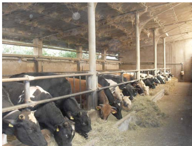
Fattoria del "Clementin" Cogliate

Ore 18,00 Rientro presso l'area feste di via Verdi a Ceriano Laghetto